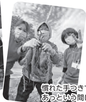
慣れた手つきであっという間に収穫終了