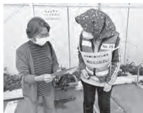
ながぬまショッピングパーク アスク