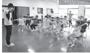
講師を迎えてリハビリ体操を実施