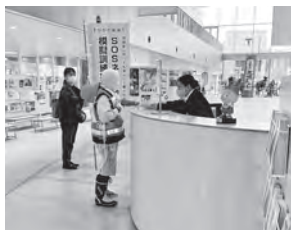
市民交流センター tette