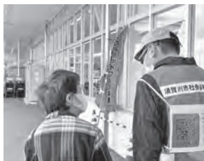
ザ・ビッグ須賀川店