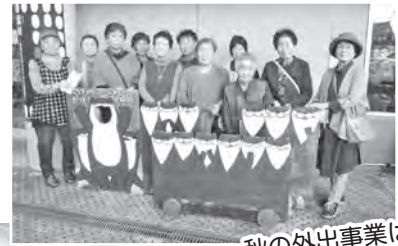
秋の外出事業は猪苗代町へ