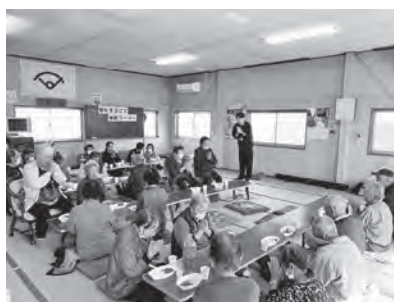
子どもから高齢者まで参加