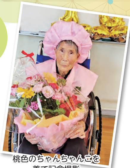
桃色のちゃんちゃんこを 着て記念撮影

元気に100歳の誕生日を迎え、休まずデイサービスを利用されています。食欲もあり、脳トレにも積極的に取り組まれています。誕生会のカラオケを楽しみにしており、元気いっぱい歌ってくれます。