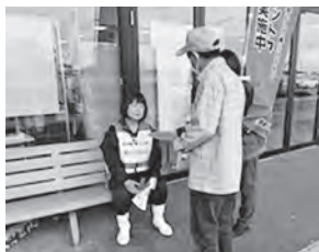
ヨークベニマル須賀川森路店

市内4か所で、事業の周知啓発と実際に行方不明者を発見した時、本人の気持ちに配慮した声掛けや見守りなどを目的とした『模擬訓練』を行いました。当日は沢山の方々に声掛けの体験をして頂きました。