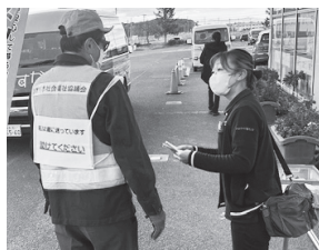
ながめまショッピングパーク アスク