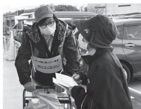
ヨークベニマル 須賀川南店

今回、市内3か所で認知症の方が自宅を出た後、家に帰れなくなったことを想定した模擬訓練を行い、認知症で困っている人への対応や声掛けの仕方を地域の方に体験していただきました。