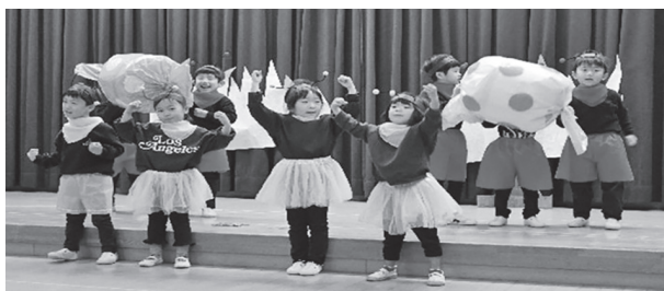
▲年中児による「ありんこのアリー」