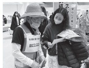
市民交流センター tette