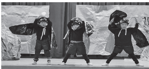
▲年長児 言語劇「スイミー」