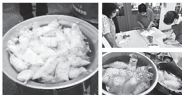
炊き出し訓練の様子