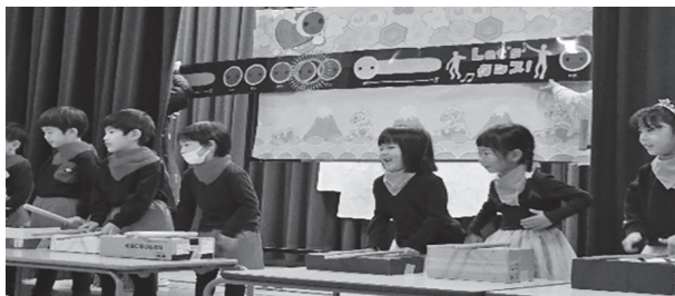
▲年中児による「太鼓の達人」