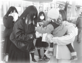
須賀川創英館高校