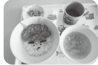
お給食は おにさん丼

自分たちで作ったおめんをかぶり、鬼を退治しました！ 今年1年みんな元気にすごせますように☆