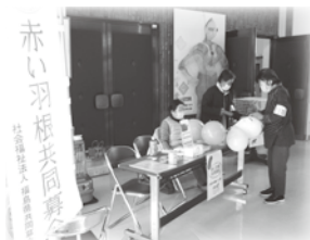
ながぬまボランティア会