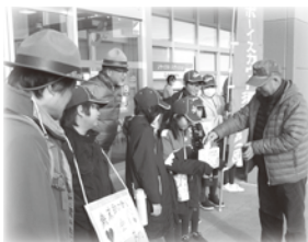
ボーイスカウト 須賀川第1団